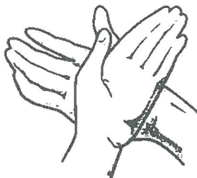
Pravá dlaň myje hřbet levé ruky