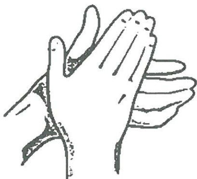
Dlaň myje dlaň *