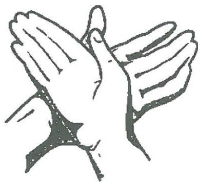
Levá dlaň myje hřbet pravé ruky