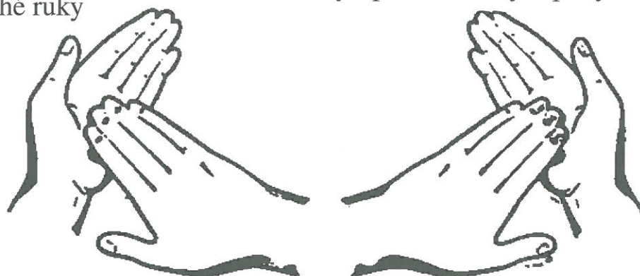
Mytí dlaní otáčivým pohybem