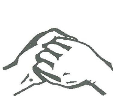
Hřbetní strana prstů v dlani druhé ruky